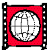
LE FESTIVAL DES FILMS DU MONDE

val, seule œuvre québécoise en lice, le film avait constitué un vrai coup de cœur public et critique. À lui aussi, le prix du film canadien le plus populaire (octroyé par votes publics). Mais Gaz Bar Blues arrive en seconde position pour le prix Air Canada (donné aussi par vote populaire aussi pour des films de toutes origines) après Quatrième étage de l'Espagnol Antonio Mercero. Plus étonnant, le film de Bélanger récoltait également le Prix œcuménique, sans doute à cause de sa portée humaine. C'est la première fois que le jury œcuménique prime une œuvre nord-américaine dans ce festival. Le FFM porte chance au talentueux Louis Bélanger, puisque son premier long métrage Post Mortem y avait déjà récolté en 1999 le prix de la mise en scène.